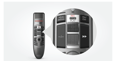
Interrupteur à curseur (enregistrement, arrêt, lecture, retour rapide)